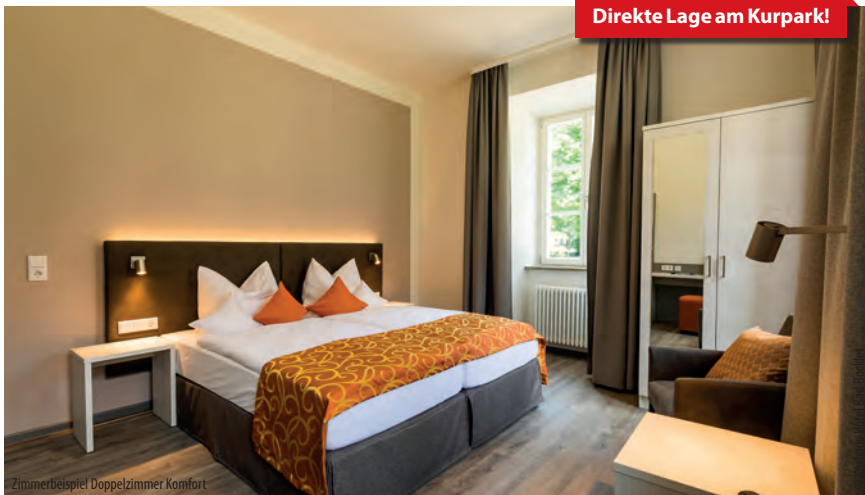
Zimmerbeispiel Doppelzimmer Komfort