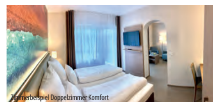
Zimmerbeispiel Doppelzimmer Komfort