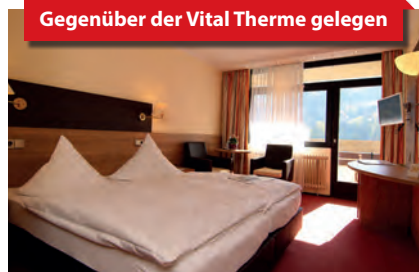
Gegenüber der Vital Therme gelegen

HP: Frühstücksbüfett, Abendessen als 3-Gang-Menü