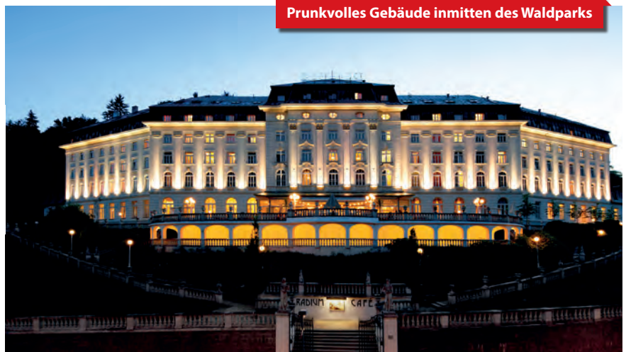
Prunkvolles Gebäude inmitten des Waldparks

Radonbäder, Bäder mit Zusätzen, Reflextherapie, Heil- und Wassergymnastik, Mechano-, Physikalische Therapie, Elektro-, Magnet-, Lasertherapie, Inhalation, Heil- und Unterwassermassage, Lymphdrainage, Trockene Kohlendioxidbäder, Gasinjektionen und Paraffinpackungen für die Hände Gegen Gebühr u. a.: Sauerstofftherapie, mobilisierende und Manipulationstechniken (manuelle Medizin). Thai-, Shiatsu- und Hot-Stone-Massage, Salzhöhle und weitere Anwendungen im Kurzentrum Agricola