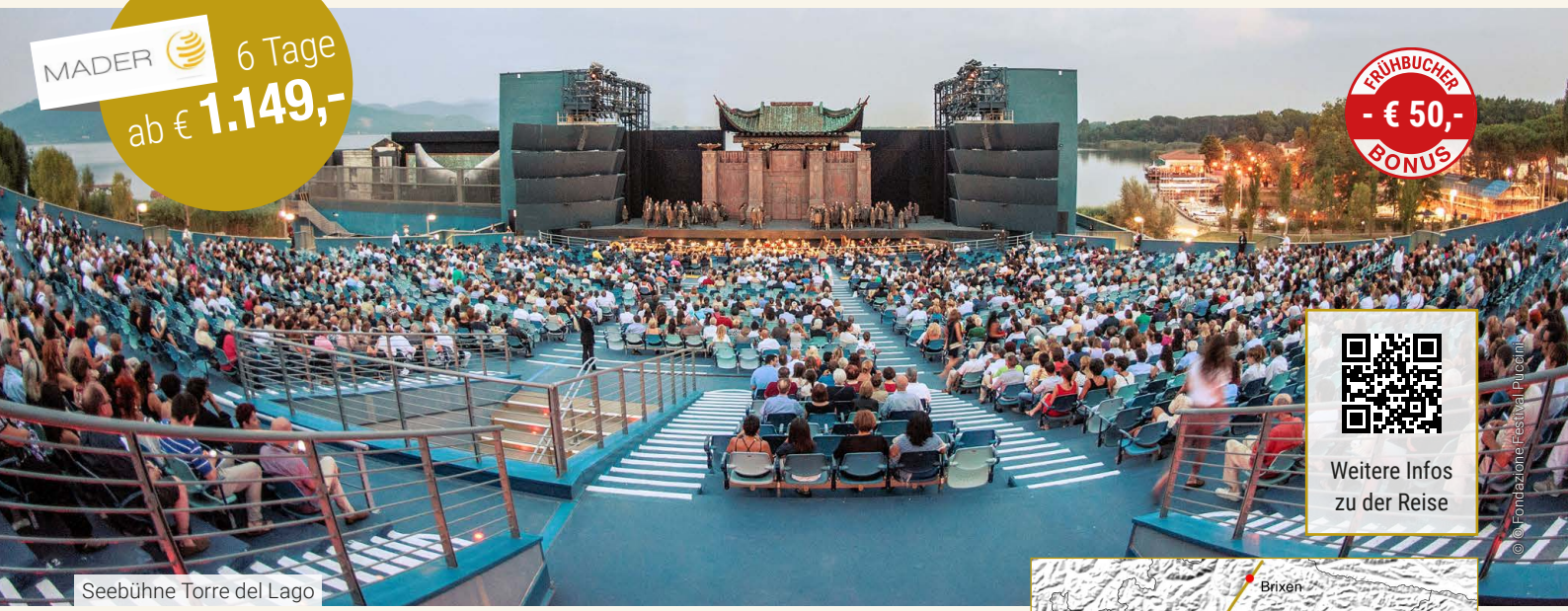
Seebühne Torre del Lago