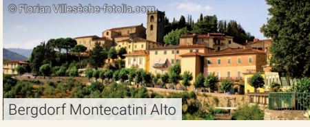
Bergdorf Montecatini Alto

Cremona, die Stadt Monteverdis und Stradivaris, hat bedeutende Schätze aufzuweisen, die wir bei einer Stadtführung erkunden. Allen voran das 2013 neu eröffnete „Museo dei Violini“ mit den wertvollsten Geigen der Welt (Hörprobe!). Von einzigartiger Schönheit ist auch der Domplatz mit dem herrlichen Ensemble von „Torrazzo“, Dom, Baptisterium und Palazzo Comunale. Nach der Stadtbesichtigung Fahrt über den Apennin an die Küstenlandschaft der Versilia. Aufenthalt an der malerischen Promenade von Forte dei Marmi. Am Abend erreichen wir Montecatini Terme, unseren Standort für 3 Nächte. Abendessen im Hotel Torretta****.