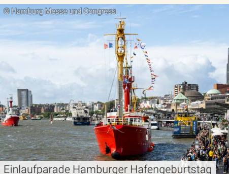
Einlaufparade Hamburger Hafengeburtstag