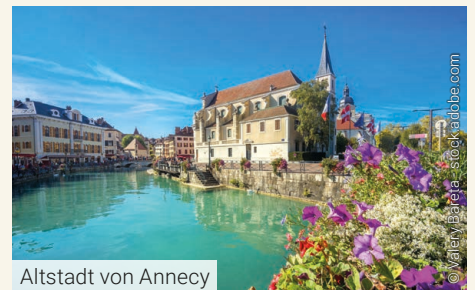
Altstadt von Annecy

Fahrt entlang des Nordufers des Genfersees vorbei an Lausanne nach Nyon. Von dort überqueren wir den Genfersee auf einem Schiff nach Yvoire. Aufenthalt in dem mittelalterlichen Ort am französischen Ufer des Genfersees. Nun weiter zum Montblanc-Massiv nach Chamonix. Längerer Aufenthalt mit Möglichkeit zur Fahrt mit Europas höchster Bergbahn auf die Aiguille du Midi oder auf den Brevent. Auf der Autobahn über Bonneville nach Annecy, der Hauptstadt Hochsavoyens. Spaziergang zum Palais de l'Isle, das auf einem Inselchen im Thiou liegt. A. N. im Hotel Best Western Plus Hôtel Carlton, Annecy