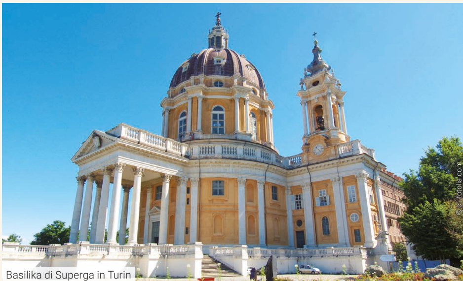
Basilika di Superga in Turin