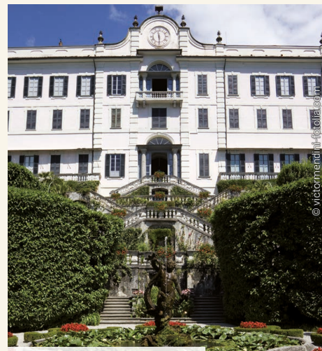
Villa Carlotta am Comer See

6. TAG: Turin - Varenna am Comosee Fahrt nach Turin, der ehemaligen Hauptstadt des Herzogtums Savoyen. Besichtigung des Palazzo Reale auf der Piazza Castello mit den reich dekorierten Repräsentationsräumen des savoyardischen Königshauses. Weiters Besuch der Kirchen San Lorenzo, einem bedeutenden Bau des Barockarchitekten Guarino Guarini sowie die Kathedrale San Giovanni Battista mit der Kapelle Santa Sindone. Weiterfahrt zu den oberitalienischen Seen, zu unserem Hotel am Comosee. A. N. im Hotel Albavilla Hotel & Co, Como