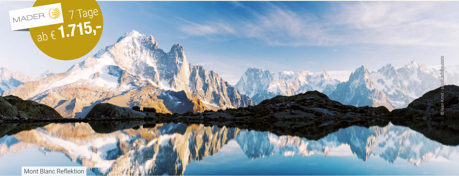
Mont Blanc Reflektion

Diese Reise erkundet das Gebiet des ehemaligen Herzogtums Savoyen, das sich einst über Teile der Schweiz, Frankreichs und Italiens erstreckte. Im Umfeld der überaus eindrucksvollen Gebirgskulisse des Mont Blanc haben sich auch beeindruckende Stätten von Kunst und Kultur entwickelt. Im Laufe dieser abwechslungsreichen Reise reisen wir in einem schönen Panoramazug von Interlaken zum Genfersee, überqueren den See per Schiff und erheben uns mit zwei faszinierenden Gondelbahnen zum höchsten Berg Europas!