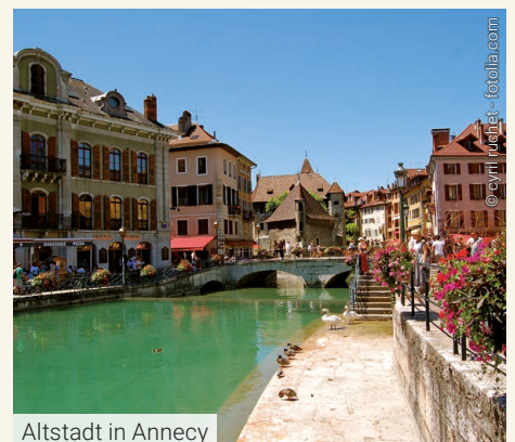
Altstadt in Annecy