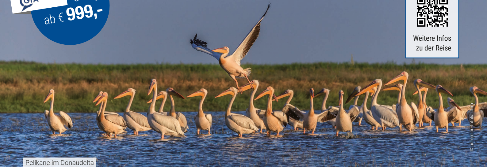
Pelikane im Donaudelta