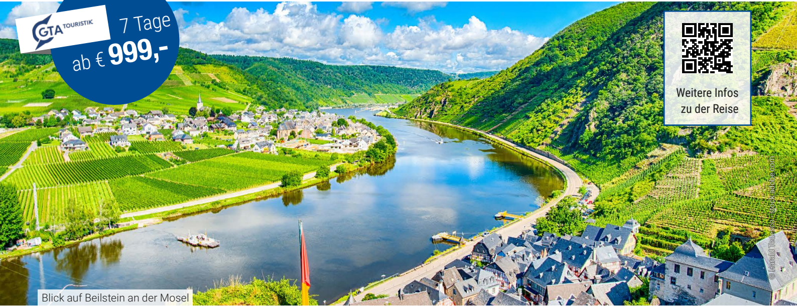
Blick auf Beilstein an der Mosel

Entdecken Sie mit der MS Aurora die malerische Mosel und den mächtigen Rhein von ihren schönsten Seiten. Ausgehend von Mainz begeben wir uns auf eine Flusskreuzfahrt, die keine Wünsche offenlässt. Kleine mittelalterliche Städtchen wie Cochem gibt es dabei genauso zu bewundern wie die historisch wichtige Stadt Trier oder die pulsierende Metropole Koblenz. Dazwischen erleben Sie Natur und Kultur im Überfluss entlang unserer abwechslungsreichen Reiseroute.